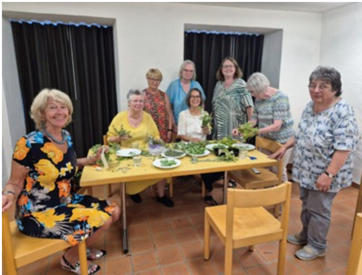
Kräuter binden August