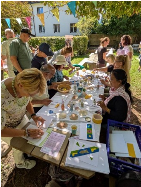
Pastoralraum Feier August